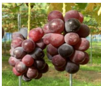
着色不良のブドウ果房